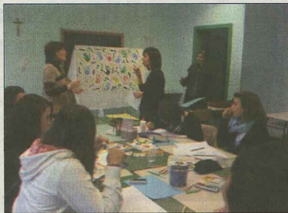
Docenti e allievi in laboratorio